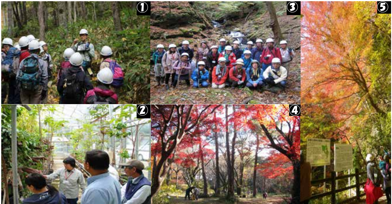
①北海道演習林, 10/6, 38名 ②樹芸研究所, 10/23, 9名 ③秩父演習林, 11/1-2, 93名 ④田無演習林, 12/1, 76名 ⑤千葉演習林, 11/22-23, 11/30-12/1, 延5,656名

森林に親しむのに適した秋になり、木々の紅葉も鮮やかになってきました。今年度は、10月6日の北海道演習林で神社山自然観察路の一般公開を皮切りに、樹芸研究所で温室特別公開、秩父演習林で自由見学とワサビ沢展示室の特別公開、田無演習林で休日公開、千葉演習林で紅葉の一般公開が行われました。参加人数は1万人を超える大規模なものから少人数のものまでいろいろですが、それぞれの特色を活かした目的やテーマを設定し、参加者の皆さんに楽しんで頂けるよう工夫を凝らしています。参加者からは、普段は親しむ機会の少ない森林の素晴らしさを知ることができた、野鳥や動植物を間近で見ることができた、植物の香りの複雑さに感動した、などの声が寄せられています。