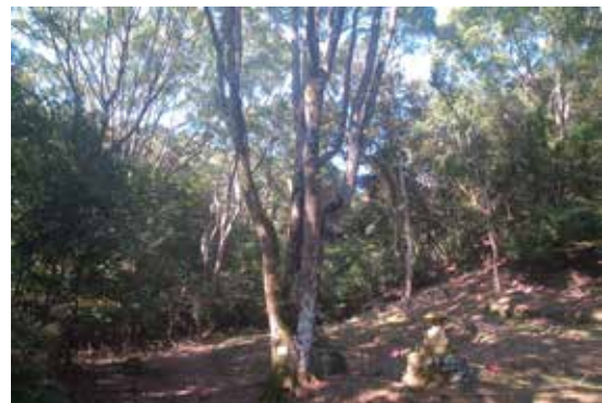
岩樟園クスノキ人工林の入り口 灯籠が歴史を感じさせる

樟脳は、人類史上初の熱可塑性合成樹脂であるセルロイドの原料として重要で、1899年に台湾樟脳専売制が施行されて樟脳価格が高騰すると、全国にクスノキ造林ブームが興ったのです。しかし、1920年代に登場した合成樟脳にシェアを奪われ、1950年代には安全性の高いセルロースアセテートなどが登場して樟脳需要自体がなくなりました。今では樟脳もその専売制も知る人は多くありません。弊所ではシカ食害を受けにくいクスノキにもう一度光を当てる取り組みを始めています。