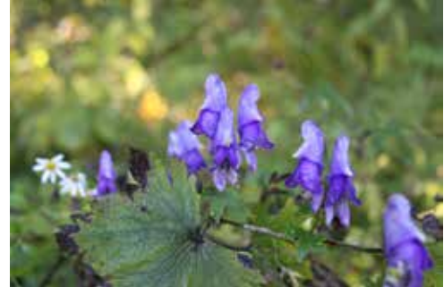
ヤマトリカブトの花

9～10月にかけて、秋の気配が漂う林内の歩道脇に、紫色のきれいな花を数多く見ることができます。実は、これらはトリカブト（ヤマトリカブト）です。トリカブトは、花の形が舞楽の衣装の烏兜に似ていることからその名が付いたと言われていています。全体が有毒で、古来アイヌの人々は、特に毒性の強い根の部分の部分を矢毒として狩猟に用いていました。現在でも、芽吹きの際に、若葉をヨモギやニンソウと間違えて誤食する中毒事故が時々起ります。このように猛毒をもつトリカブトですが、漢方では乾燥させた根を「フシ」と呼び、薬としても利用されています。