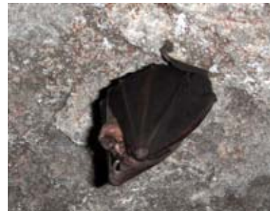
トンネルでコウモリを発見

注）キョン：シカ科 ホエジカ属の小形のシカでもともと中国東部や台湾に生息して本来、日本にはいない動物である。千葉県のカキョウは1980年前後に南房総の観光施設から逃げ出したものと言われ、4000頭はいるものと推定されている。特定外来生物で有害獣駆除を行っている。