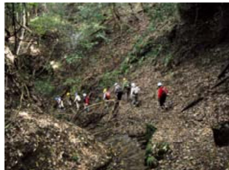
堂沢の歩道を歩く

途中、岩が濡れていて苔が生えていたり、隙間のある丸太の橋がありすべりやすいので慎重に歩道を歩きます。丸太橋を渡ることに自信のない方は沢を横断して迂回しました。