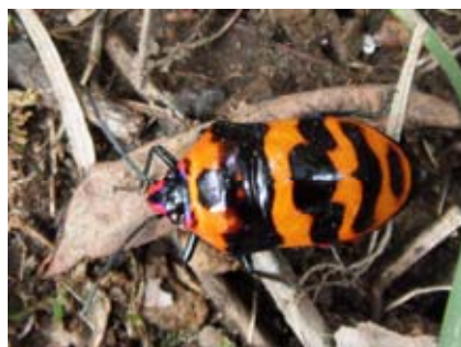
オオキンカメムシ