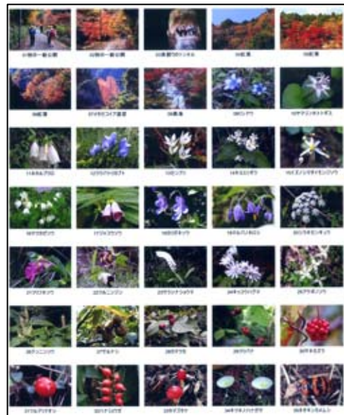
このような下敷きを作ります