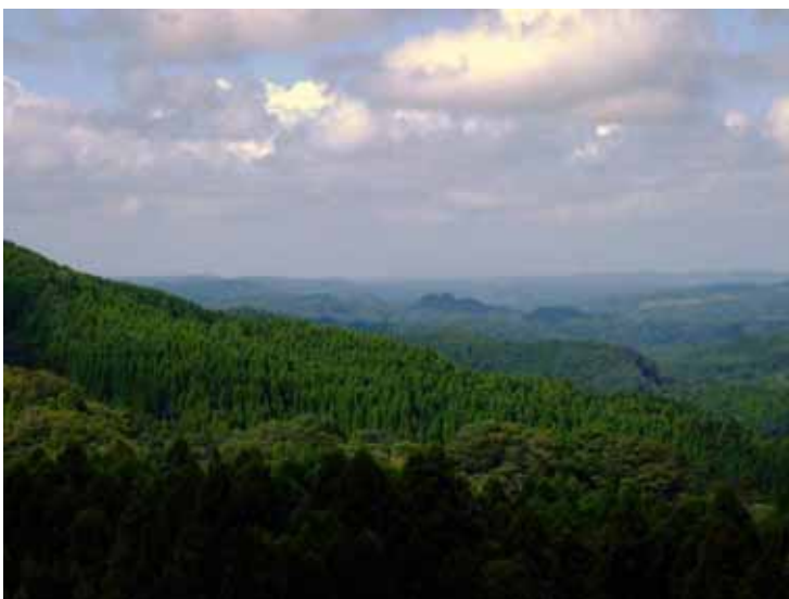
晴れていたら見に行く予定だった養老溪谷方面の眺め

今回のバーベキューの場所は夜間照明もある屋根のある車庫を使わせてもらっているため雨の影響を心配せずに済みます。