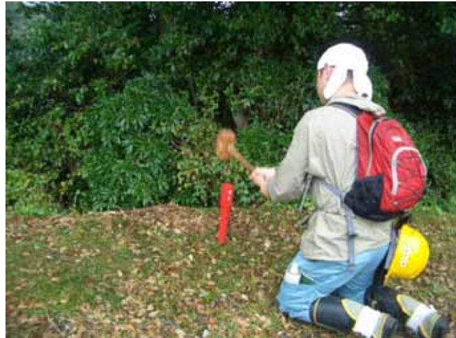
木槌で杭をうっています

赤い杭を持ち、演習林の三次さんと一緒に清澄を出発しました。検縄で100メートルの杭の間隔を確認しながら、なくなってしまった杭の場所に新しい杭を設置しました。時々杭があっても色が褪せてしまったために見逃して「無し」と記録されていたものもあり、これも新しい杭に交換しました。