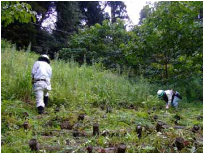
「天津小の森」での下刈り作業

郷台作業所まで無事杭を設置し終わり、車で今日の作業の成果を見ながら清澄作業所に帰りました。杭がよく目立つようになって嬉しかったです。