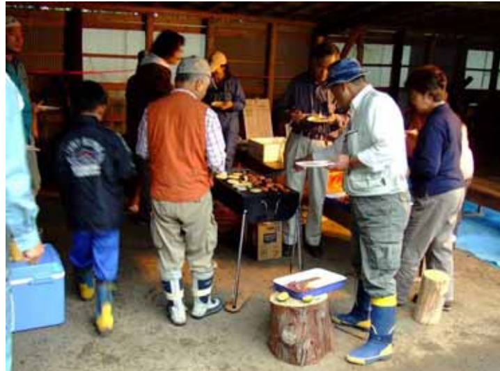
バーベキューの様子

29日は朝から雨降りでしたので、清澄から、全員車で札幌へ移動した後にすぐにバーベキューの夕食の準備にか