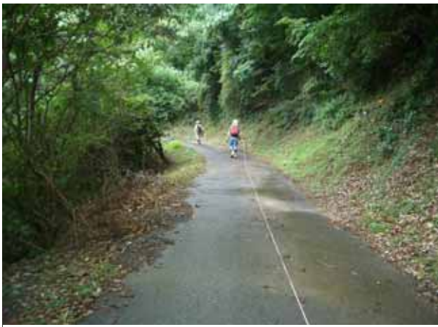
検縄で杭の間隔 100m を測ります

8月23日(木)から24日(金)にかけて、久々にAbiesの活動に参加しました。