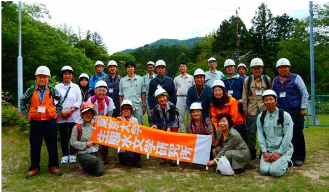
赤津研究林での集合写真