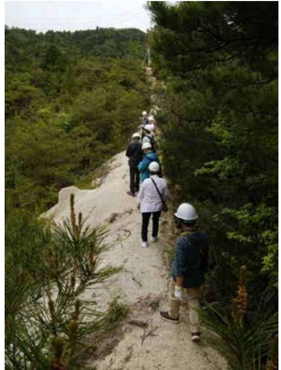
はげ山の名残が残る尾根を歩く