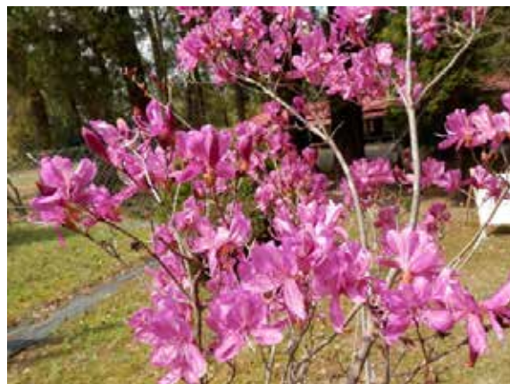
キヨスミミツバツジ

(花が咲いていた木:エゾノコリンゴ、シキミ、カリン、ミツバツジ、キヨスミミツバツジ、ヤマグルマ、ヤエザクラ、オオシマザクラ)