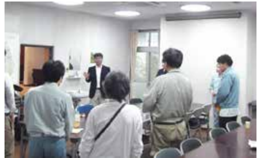
林長の講評と挨拶（清澄宿舎にて）