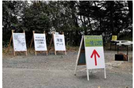
清澄側入り口受付

1. 参加人員を半分に分けて、清澄側の受付に残る班（A 班とします）と郷台側の受付に行く班（B 班とします。）を決めます。B 班には郷台のガイドが出来る人を必ず入れます。原則として責任者がガイドをするので B 班に入り、副責任者が A 班に入ります。