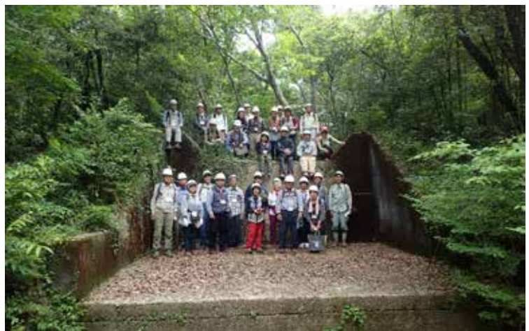
林業遺産に登録された土堰堤での集合写真