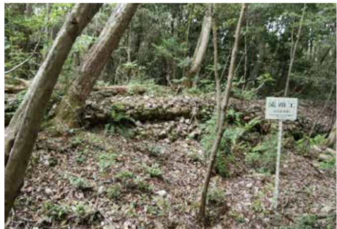
犬山研究林で見た砂防工法のひとつ、流路工