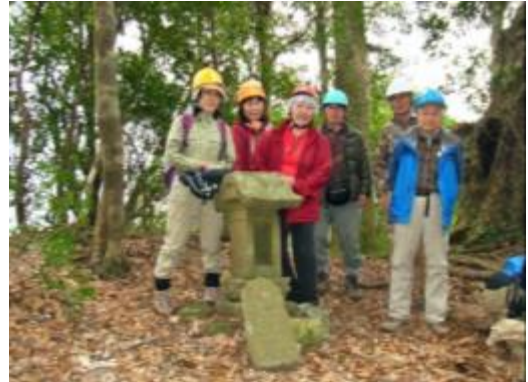
浅間山山頂での集合写真

13時に清澄に帰ってきたら雨が降り出し、歩いている間は天気が持ってくれて良かったと感謝し、解散しました。