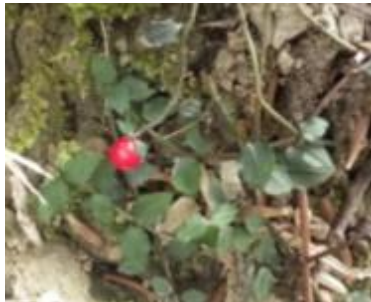
ツルアリドオシ (実)