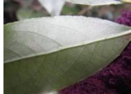
シャシャンボ (葉のウラ)